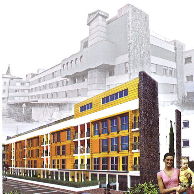
Réhabilitation de l'ancien hôpital en 50 logements et bureaux / FOIX (09)

La légèreté des structures, la rapidité d'exécution en filière sèche et la propreté des chantiers sont des atouts supplémentaires en site occupé.