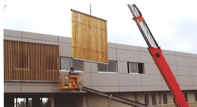
Construction d'un Collège / QUINT FONSEGRIVES (31)

Maître d'Ouvrage : Conseil Général Haute Garonne