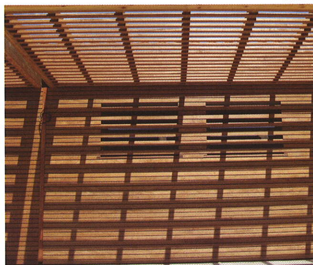
Crèche / FONSORBES (31)

Maître d'Ouvrage : SIVOM du Canton de Saint-Lys