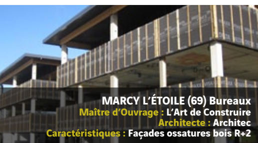
MARCY L'ÉTOILE (69) Bureaux Maître d'Ouvrage : L'Art de Construire Architecte : Architec Caractéristiques : Façades ossatures bois R+2