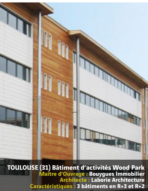
TOULOUSE (31) Bâtiment d'activités Wood Park Maître d'Ouvrage : Bouygues Immobilier Architecte : Laborie Architecture Caractéristiques : 3 bâtiments en R+3 et R+2