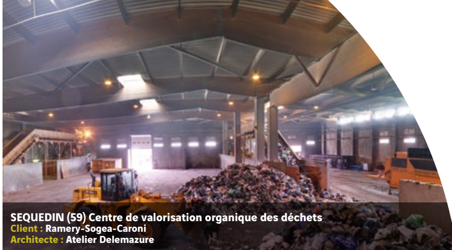
SEQUEDIN (59) Centre de valorisation organique des déchets Client : Ramery-Sogea-Caroni Architecte : Atelier Delezazure