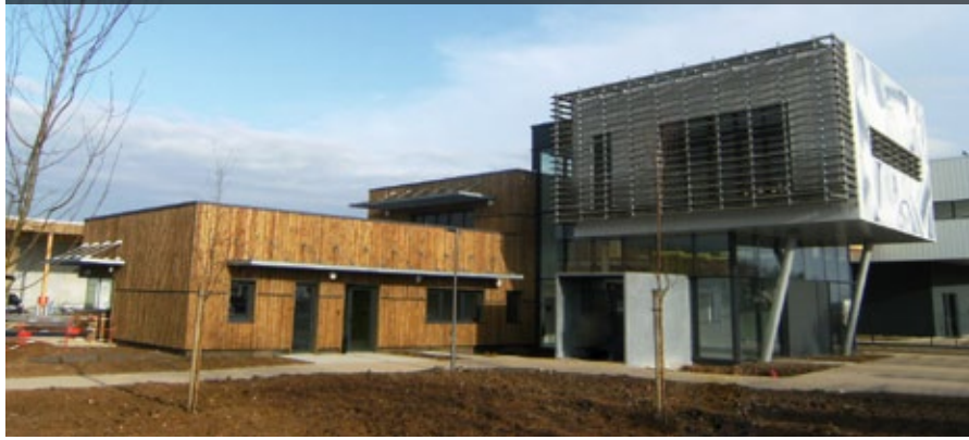
VILLARS DE LANS (38) Station d'épuration Client : Campenon Bernard Architecte : David Ferré