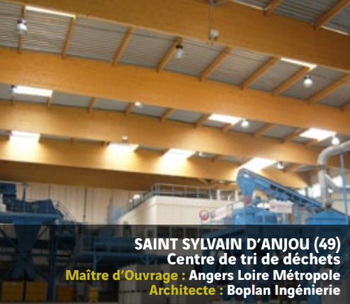
SAINT SYLVAIN D'ANJOU (49) Centre de tri de déchets Maître d'Ouvrage : Angers Loire Métropole Architecte : Boplan Ingénierie